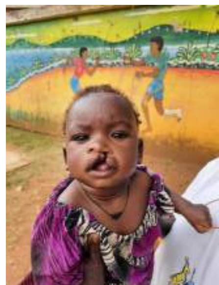
Figuur 17. CoRSU team tijdens een voorlichting over schisis, hazenlipjes, in Kaabong Figuur 18. Kindje met een hazenlipje uit Nakapiripirit, in CoRSU ziekenhuis