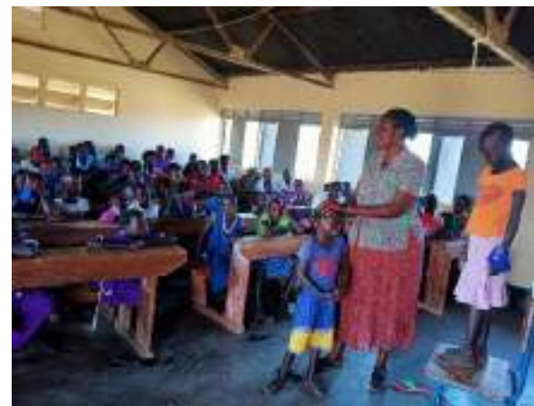
Figuur 8. Vrouwelijke pastoor met de leerlingen

Daarnaast werden alle kinderen getest voor HIV / Aids. Van alle geteste leerlingen werden vier leerlingen positief gevonden. Deze informatie was al bij ons bekend; gelukkig dus geen nieuwe HIV besmettingen. Tenslotte werden alle meisjes van 10 jaar en ouder getest voor zwangerschap. Helaas waren de resultaten van drie meisjes positief. De resultaten van die test zijn voorzichtig aan de meisjes en hun ouders en verzorgers gecommuniceerd. Omdat de meisjes meerderjarig zijn en zelf toegestemd hebben met de seksuele relaties, kan CCA geen verdere actie ondernemen. De drie meisjes zullen vooralsnog stoppen met school en eerst bevallen van hun kindjes.