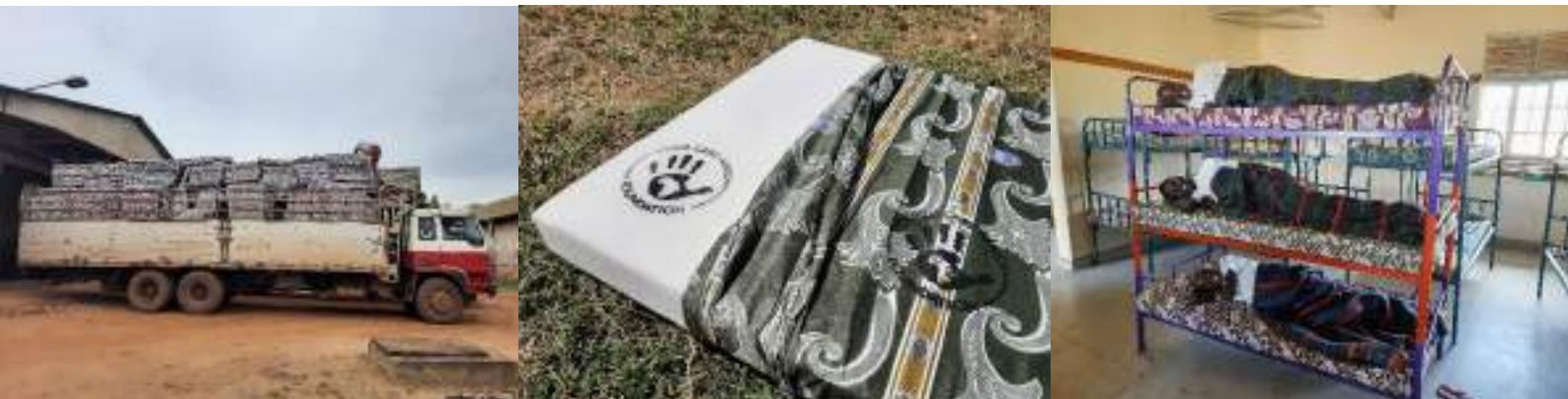
Figuur 10 t/m 12. Matrassen, bedden en dekens voor scholen in Karamoja

In december ontvingen twee basisscholen in Amudat matrassen, dekens en bedden. De beide scholen huisvesten meerdere van onze sponsorleerlingen en vangen daarnaast leerlingen op die geen schoolgeld kunnen betalen en (nog) niet gesponsord worden. De gemengde basisschool Katikit ontving 80 matrassen, 80 dekens en 17 stapelbedden (3-hoog). De katholieke jongensschool Kalas ontving 60 matrassen en 60 dekens. In Kalas werden 52 oude en kapotte bedden gerepareerd en geleverd.