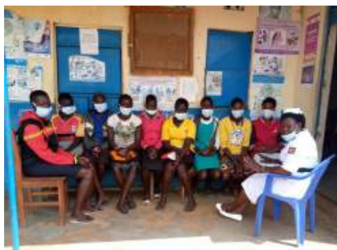
Figuur 15. Seksuele voorlichting bij AWARE

Examenleerlingen mochten in oktober terugkeren naar school voor hun examens. In december behaalde onze eerste leerlinge ooit (!) haar diploma voor de 2-jarige opleiding in “Social mobilization & Development”. Deze gedreven en enthousiaste jongedame blijft betrokken bij het werk van CCA in Karamoja, in het bijzonder bij ons programma voor kinderen met een handicap.