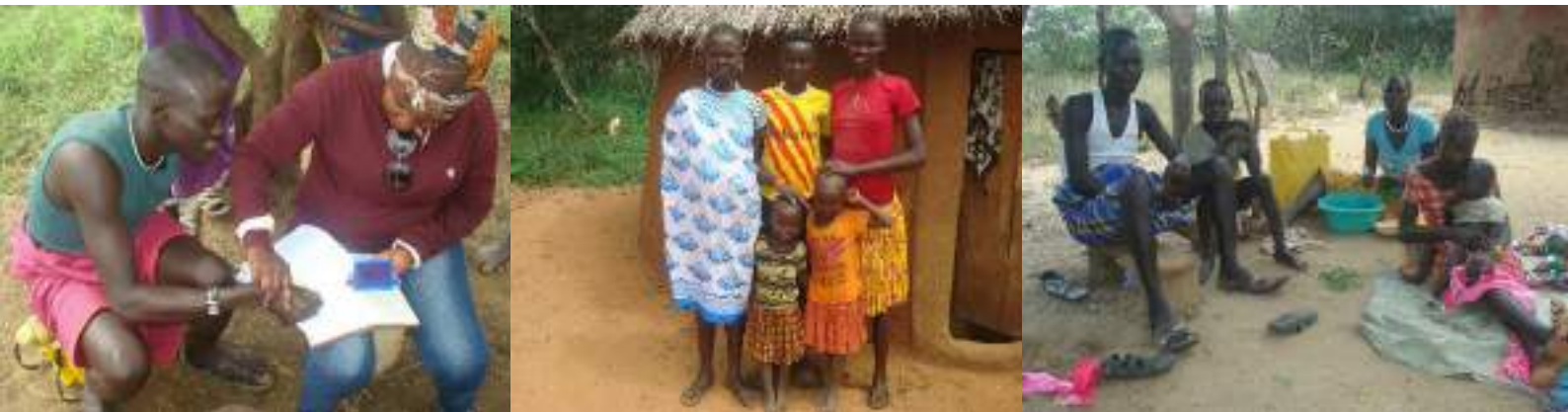
Figuur 5 t/m 7. Foto's genomen tijdens huisbezoeken

Wat volgde waren moeilijke en onzekere omstandigheden. Het team in Amudat kon gelukkig na een tijdje wel bij de leerlingen thuis langs. Deze huisbezoeken vonden de daaropvolgende maanden nog geregeld plaats. Tijdens de huisbezoeken kon het team het welzijn van de gesponsorde leerlingen achterhalen en waar nodig extra hulp bieden. De huisbezoeken werden tevens gebruikt om de ouders en verzorgers te wijzen op de rechten van kinderen. Ook de ouders en verzorgers van de 55 nieuwe sponsorleerlingen tekenden de overeenkomst met CCA.