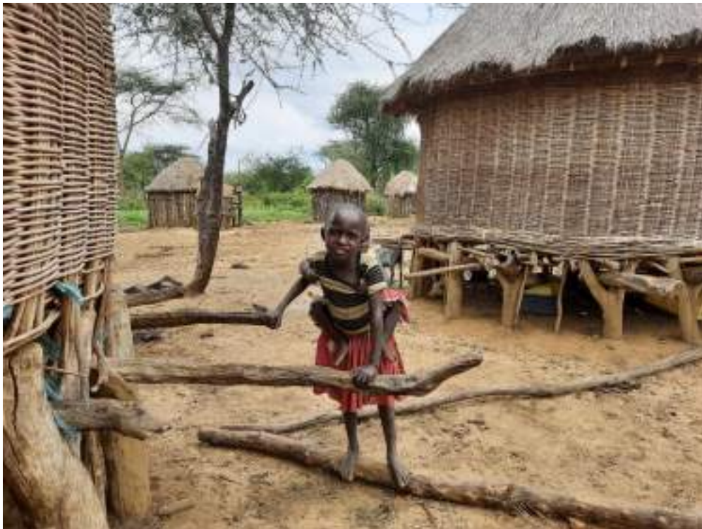
Figuur 1. Een meisje in Loro, Amudat