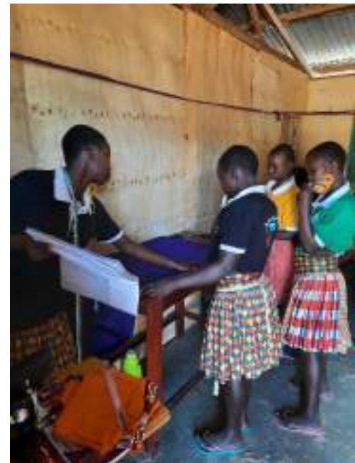
Figuur 22. Meisjes in de Kalas opvang krijgen naailes