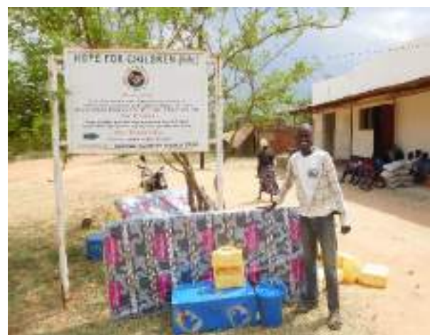
Figuur 4. Een nieuwe leerling, blij met alle hulp van CCA

De 55 nieuwe leerlingen ontvingen in februari, aan het begin van het schooljaar, allemaal een grote metalen kist vol met schoolspullen, slaapspullen en toiletartikelen. De kist heeft een slotje, zodat de kinderen hun spullen op school veilig kunnen bewaren. De 48 leerlingen die CCA al sponsorde sinds 2019, ontvingen een pakket met lesmaterialen en toiletartikelen voor het nieuwe schooljaar. Onder begeleiding van HFC medewerkers begonnen 103 leerlingen vol enthousiasme aan het schooljaar.