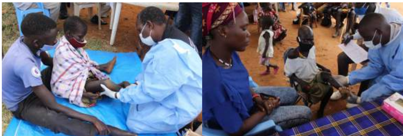
Figuur 19 & 20. Kinderen in Karamoja met artsen van CoRSU ziekenhuis

Zoals vermeld ontving CCA in november 2020 een team van specialisten van CoRSU ziekenhuis in Napak en Kaabong. De geïdentificeerde kinderen met een handicap uit Napak zullen in 2021 geopereerd worden. Daarnaast zal CCA beoordelen of enkele kinderen met een niet medisch te verhelpen handicap ondersteuning nodig hebben in de vorm van onderwijs of een praktische leerweg.